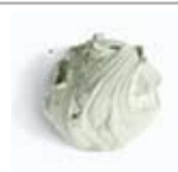
Puro Grassello di Calce CL 90

Elementi Naturali di Biocalce Intonachino Colorato 0,7