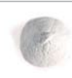
Fino di Puro Marmo Bianco di Carrara (0-0.5 mm)