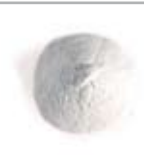
Fino di Puro Marmo Bianco di Carrara (0-0.5 mm)