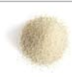
Calcare Dolomitico Granulato Fino (1.2 mm)